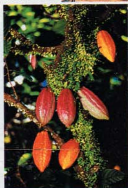
Heimat der Kakaopflanze: Mexiko. Für die Azteken war Kakao die „Speise der Götter“

Abgelegt wird im Mai in Amsterdam, wo man 1828 die Kakaopresse erfand; auf der Fahrt nach Antwerpen und Brügge bringen Spezialisten an Bord (Pâtissier, Kosmetikerin) dem Passagier ihr Schoko-Wissen nahe (ab 1795 Euro, www.seacloud.com ). Wer schon vor dem Wegfahren dahinschmelzen möchte, kehrt beim Berliner Chocolatier Fassbender und Rausch, Europas einzigem Schokoladen-Restaurant, ein und probiert z. B. Rindfleisch auf Schoko-Wolke (Infos: www.fassbender-rausch.de ).