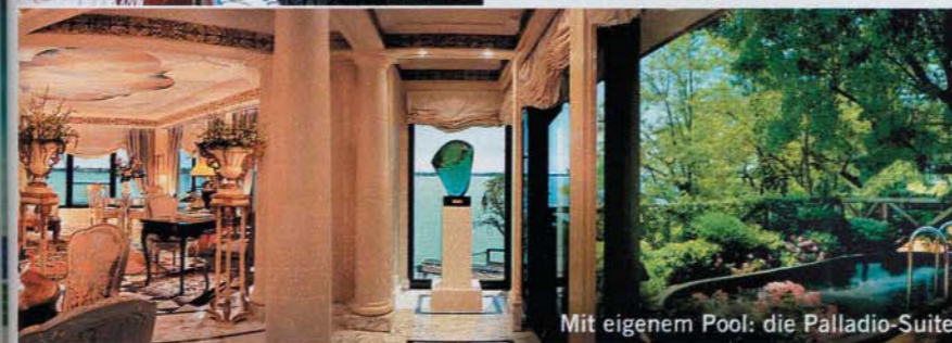
Mit eigenem Pool: die Palladio-Suite