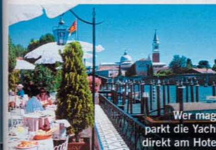
Wer mag, parkt die Yacht direkt am Hotel

Es ist todschick, voller Tradition – und einmal im Leben eine Übernachtung wert: das „Hotel Cipriani“ in Venedig, eines der exklusivsten Häuser der Welt. Natürlich wartet es mit Superlativen auf. Der Service: vielfach ausgezeichnet. Die Restaurants: beeindruckend. Das Spa: eine Oase der Ruhe. Die Palladio-Suite: eine Glaskapsel, die mit 180-Grad-Blick über dem Wasser schwebt. Und der Pool – übrigens der einzige in Venedig! – mit olympischen Ausmaßen liegt hinter lauschigen Bäumen direkt an der Lagune. Kein Wunder, dass hier nicht nur während der Biennale reichlich Stars absteigen: Angelina Houston, Tom Cruise, Angelina Jolie, Harrison Ford, George Clooney, Jack Nicholson, Leonardo DiCaprio... Das Gästebuch liest sich wie das Who's who der Hollywood-Größen; ein Besuch lohnt sich also allein wegen der Möglichkeit zum Promi-Watching. Hochadel und Politik schätzen das „Cip“ ebenso. Und vielleicht steht ja in diesem Jahr etwas ganz Besonderes, Romantisches bei Ihnen an? Dann lockt das „Cipriani“ mit Angeboten wie dem „Honeymooners Program“ (ab 950 Euro/Nacht und Paar) oder dem „Romantic Venice“-Package. Und beim Paket „One more night“ darf man drei Nächte für zwei bleiben (ab 755 Euro/Nacht, www.hotelcipriani.com ).