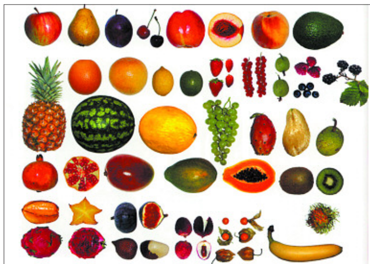
Frutas en Icoon . También hay páginas de verduras, especias, frutos secos, dulces, quesos...