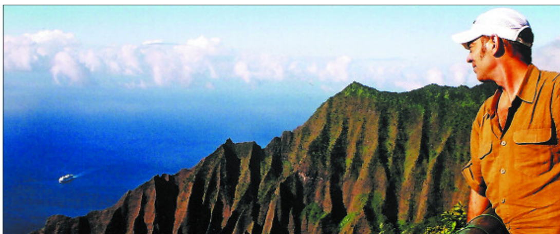
El autor, frente a los acantilados de la costa de Napali, en la isla hawaiana de Kauai.