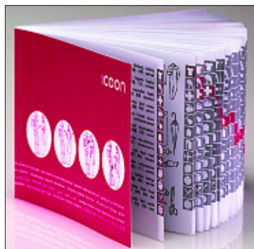
Icoon incluye 2.000 dibujos y fotos.

■ Icoon se puede comprar online en la página www.icoon-book.com . Precio: 8,90 euros más costes de envío.