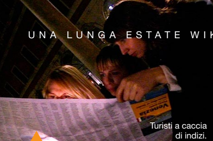
Turisti a caccia di indizi.