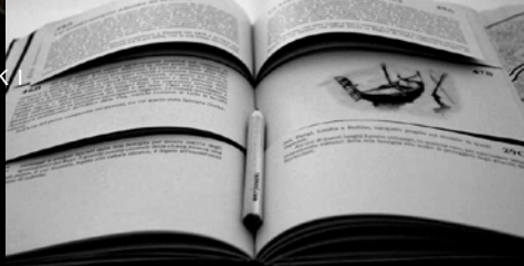
La guida "The Ruyi" (in vendita su www.theruyi.com ; €22). A destra, il team che ha progettato il gioco.