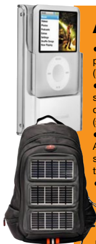
Sopra, lo zaino Voltaic Backpack. In alto, la cassa per iPod.

Il dizionario per immagini Icoon. Si compra on line su www.icoon.eu (€9).